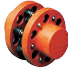
Tabela Dimensional Dimensões em mm